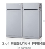
2 of RESU16H PRIME (in parallelo)

Soddisfa completamente un consumo medio giornaliero di elettricità